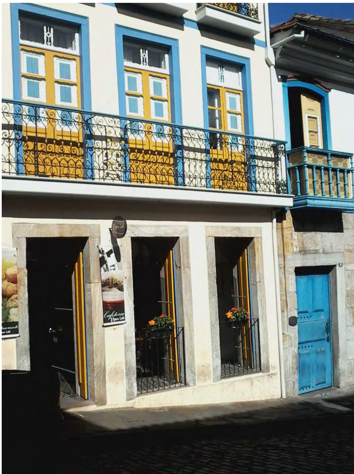
Colores de una calle de Ouro Preto, Brasil.

Las fotos de este boletín son todas de José A. Borello, a no ser que se señale lo contrario. (Pueden ser reproducidas reconociendo su fuente). Las opiniones vertidas en este documento son personales y no comprometen a la RSA.