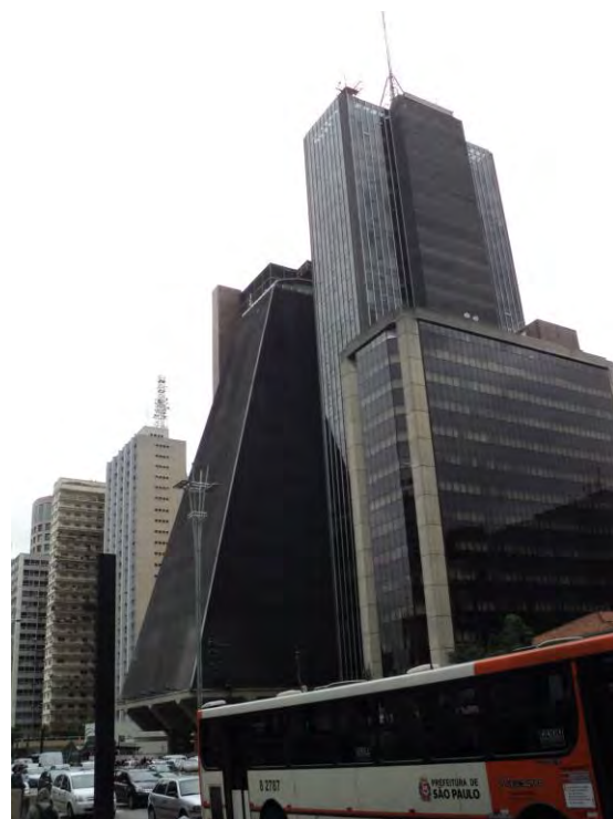
Avenida Paulista, São Paulo, Brasil