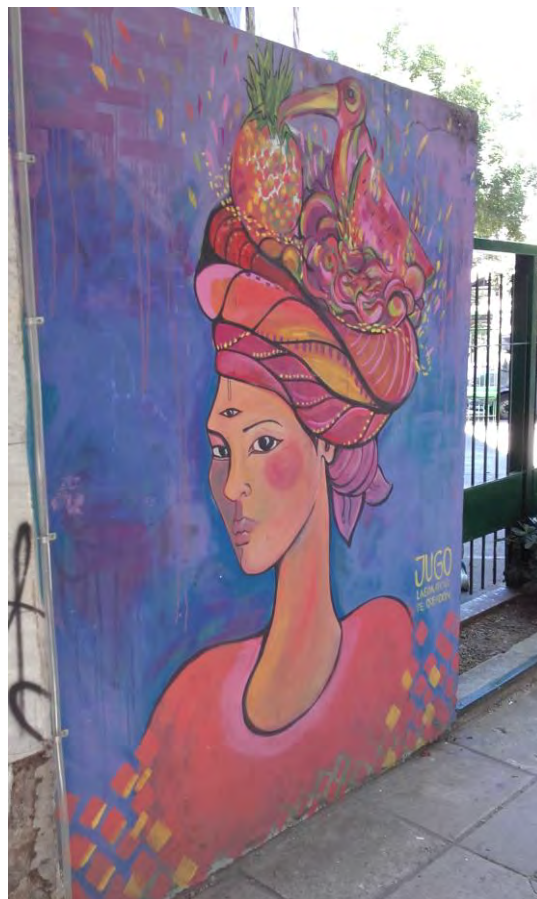
Fragmento de un mural en una calle del barrio de Palermo, Buenos Aires, Argentina

http://www.regionalstudies.org/uploads/Flyer_Funding_and_Award_2017.pdf