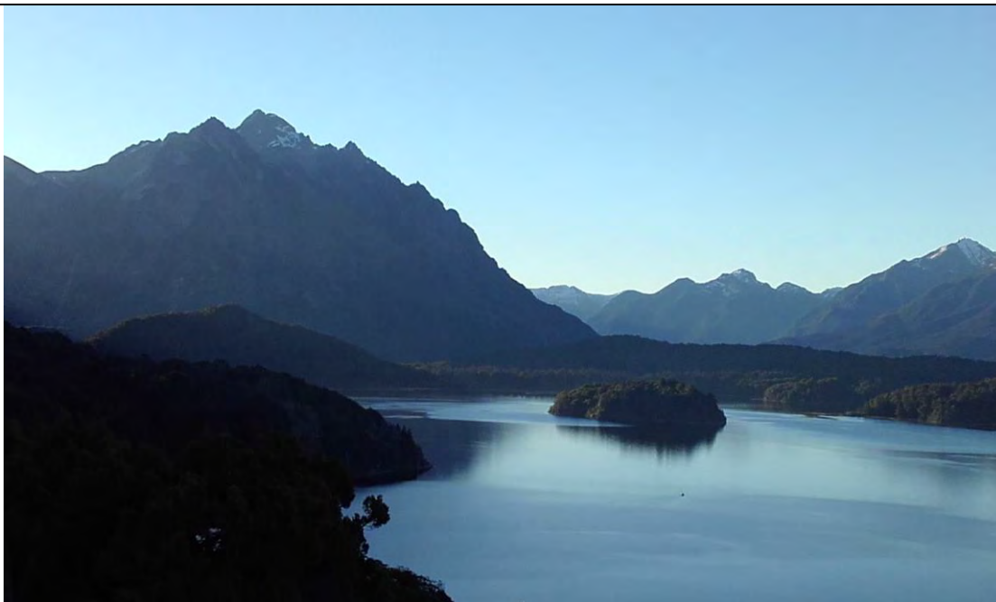
Patagonia argentina, cercanías de San Carlos de Bariloche