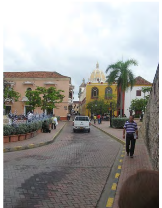
Callecita de Cartagena de Indias, Colombia