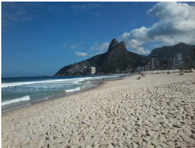
Playa de Ipanema con el morro Dois Irmãos al fondo, Río de Janeiro.

A realizarse en Resistencia, Chaco, representa la continuidad de los encuentros que se realizaron en Río Cuarto, La Pampa, Santa Fe, Mendoza y Neuquén en los años 2007, 2009, 2011, 2013 y 2015 respectivamente. El lema de esta edición "Consolidando la Geografía en Red" sugiere el trabajo conjunto y mancomunado que los Departamentos de Geografía de las Universidades Públicas de Argentina vienen realizando desde los años 1999 y 2000. Link: http://vi-congreso-nacional-geografia.webnode.com/