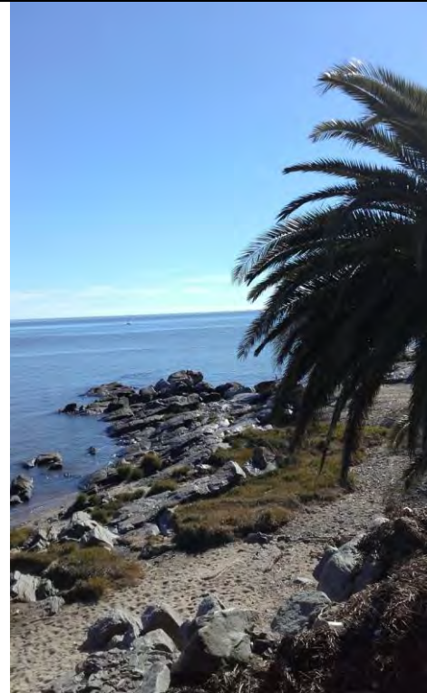
Río de la Plata, desde las costas de la ciudad de Colonia, Uruguay