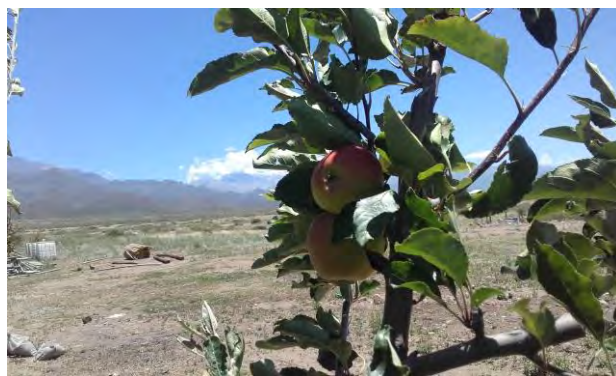
A 1.400 metros de altura, en Tunuyán, Mendoza, Argentina

http://live.v1.udesa.edu.ar/Posgrados/Programas-de-Posgrado/Doctorado-en-Educacion/Estructura-curricular